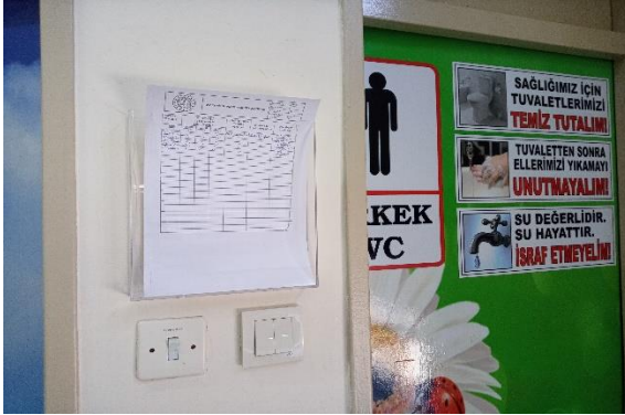
WC temizleme takip kartları