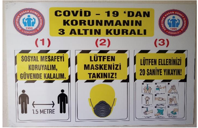
Girişte uyarı levhaları