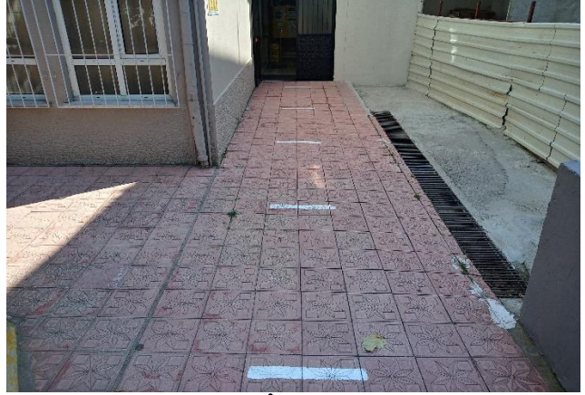
Sosyal Mesafe İşaretlemeleri