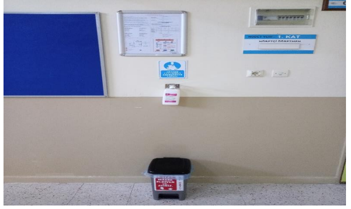
Katlarda el antiseptiği ve pedalli kovalar