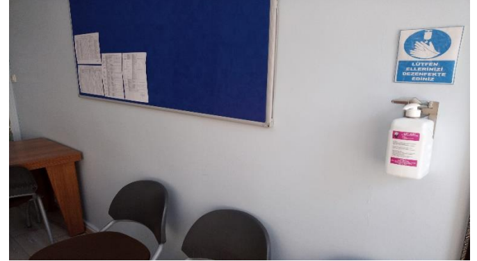
İdari odalarda el antiseptiği