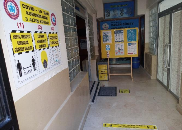
Ayak ve el dezenfekte işlemleri