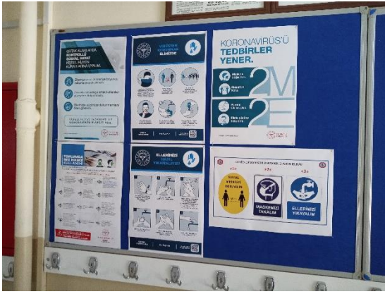
Uyarıcı ve bilgilendirici levhalar