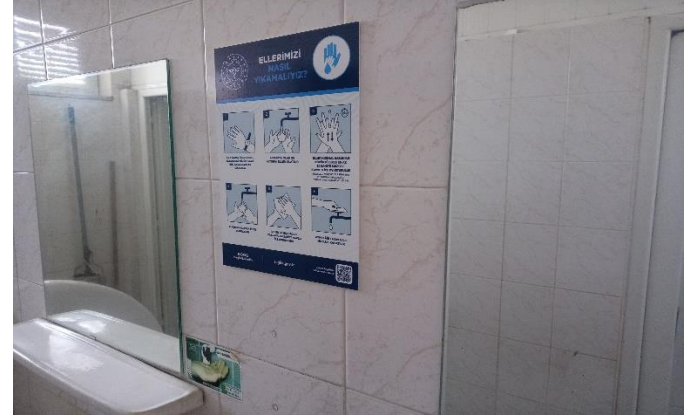
WC'lerde el yıkama afişleri sıvı sabun kağıt havlu