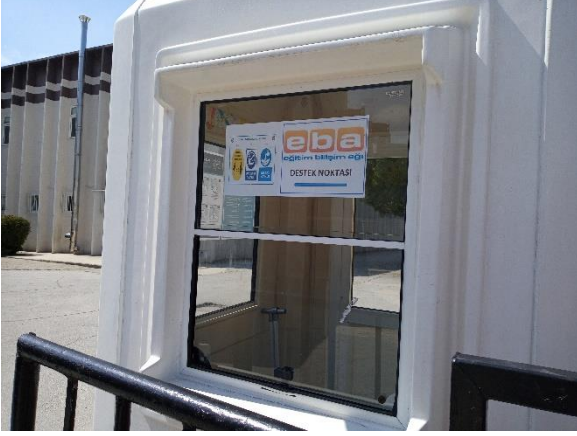
Girişte Uyarı Levhaları